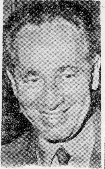
PERESZ Hogy jobb legyen a közönség véleménye

hogy a különböző településeket, illetőleg nagyobb városrészek övezeteit számmal megjelölt postai zónákra osztják és ez által leegyszerűsítik, illetve meggyorsítják a postai küldemények osztályozását és kiképzését. Ugyanakkor megkezdik munkáját három