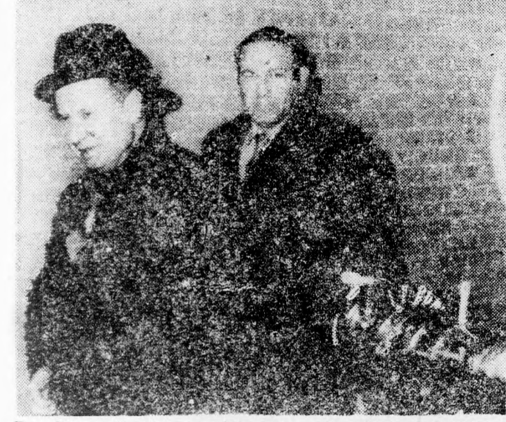
Dr. Gunnar Jarring megérkezett a new-yorki repülőtérre

• A ciprusi Limasolnál 72 ezer liter petróleum a tengerbe ömlött az Akrotiri angol bázis közelében, és a tengerpart egyelőre fűrdésre alkalmatlanná vált.