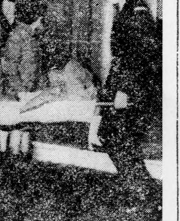
Hordályon viszik a katasztrófa egyik áldozatát

Peresz miniszter elmondotta még, hogy minisztériuma névváltozta-