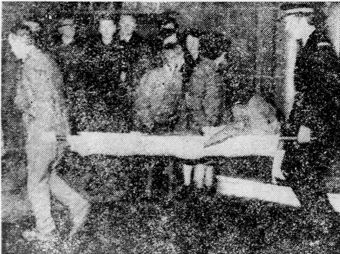
Hordályon viszik a katasztrófa egyik áldozatát

Glasgow (UPI, Reuter). — A glasgowi labdarugó derby bekövetkezett szerencsétlenség 66 áldozata közül 14-nek a személy-