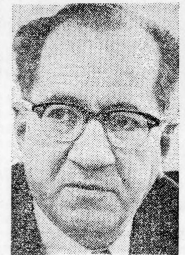
SERÉF: Kollek mindenről tudott...

megmagyarázta, hogy nemzeti érdekek vezérlik a jeruzsálemi benépesítési és telepítési tervek kidolgozásánál.