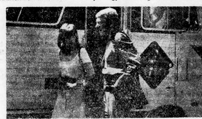
Sutherland és Fonda forgatás közben New Yorkban

Szöke, szakállas — ha éppen nem játszik — és Paul Newman nem számítva, az övé a legkézzelkeresettebb, mely valaha is megjelent a mozivászonon. Donald Sutherland ma Amerika és a nyu-