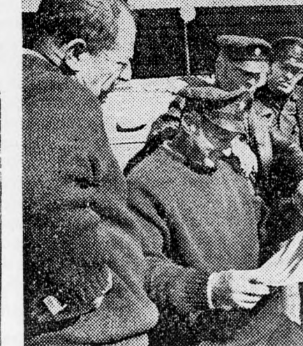
Az izraeli helyhatóságok tüzoltői tegnap az egész országban sztrájkba kezdtek, mert mindaddig nem kötöttek velük új munkaszerződést. A sztrájk alatt csakis komoly veszély esetén lépnek működésbe a tüzoltők. Képviselet a tel-avivi Bazel utcai tüzoltóállomáson újságolvasással töltik az időt.

A luddi repülőterén most lázas készülődés folyik az El-Al első Boeing-747 óriásgépeinek befogadására, ez év májusában. A hosszabb lejáratu tervek keretében 15 millió font költséggel új állomás-épületet terveznek, amely majd lehetővé teszi egyidőben három óriásgep utasainak kezelését, a normális forgalom mellett. Addig is a meglévő épületben kell kibővíteni a szolgáltatások keretét. Becslés szerint az évtized végén évi 4 millió utas veszi majd igénybe a repülőteret. Az elmúlt évben ezeknek a száma 1.1 millió volt.