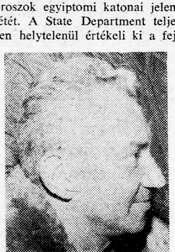
leményeket és ahelyett, hogy arra törekedne, az oroszok vonuljanak ki a Közel-Keletről, most

olyan terveket készít elő, amelyek éppen az ellenkezőjét eredményezik és állandósítják a szovjet csapatok befészkelődését a világ ezen részében.