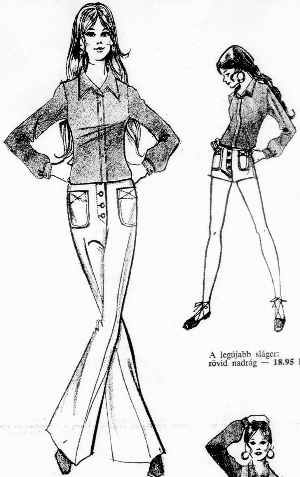
A legújabb sláger: rövid nadrág — 18.95 IL.

4 részes, összeillő együttes „Jeans” stílusban gombdiszítéssel, kihangsúlyozott zsebekkel és varrásokkal.