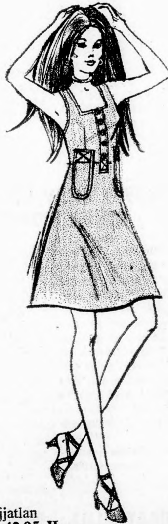
Kivágott, ujjatlan szárafán — 42.95 IL.