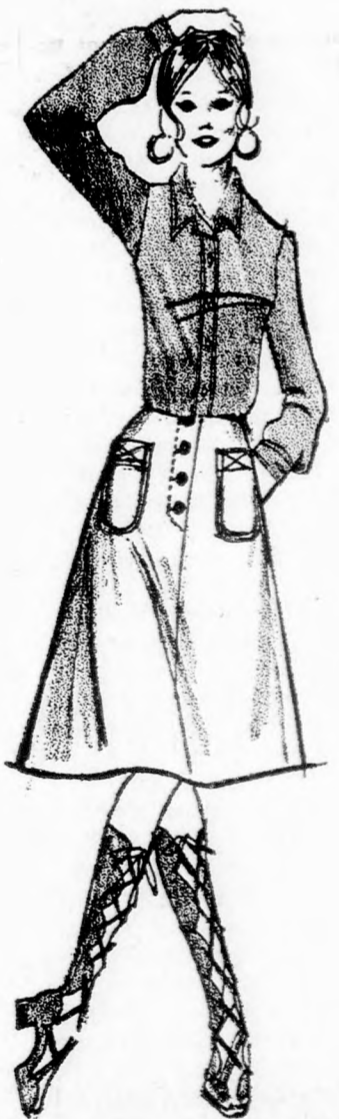
Térdigérő szoknya — 29.95 IL.