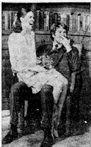
ALI MCGRAW és BOB EVANS

— Nem szeretem azokat a nőket, akik így próbálnak hatni a férfiakra, — vélekedett tucatnyi