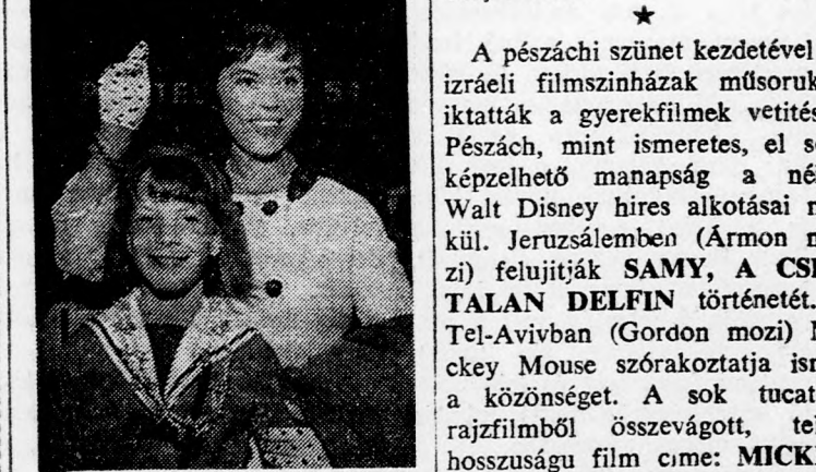
Az egykori csodagyerek, Shirley Temple ma, kislányával.

A Metro Goldwyn Mayer nyomdokain haladva, a 20th Century Fox is általános kiürítést rendezett régi kellekeiből. Allitó-