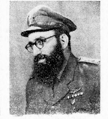
GOREN FŐRABBI Halachikus véleményezés

írónak hangnemből nyilatkozott arról a „kutatómunkáról”.