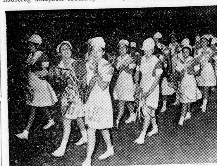
MENETEL AZ APOLÓNOK CSOPORTJA

„A földkereség legnagyobb távgyaloglása” — így jellemezte a jelenlegi háromnapos távgyaloglást Jicchák Chofi tábornok, a hadsereg kiképzési főosztályának