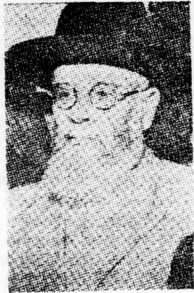
NISZIM FŐRABBI Megoldást kell találni

mely szerint kéri felmentését attól, hogy ennek az ügynek a tárgyalásában részt vegyen. Ugyancsak személyes indokokhoz fel a jeruzsálemi rabbinikus bíróság harmadik tagja, Dávid Atijá rabbi is.