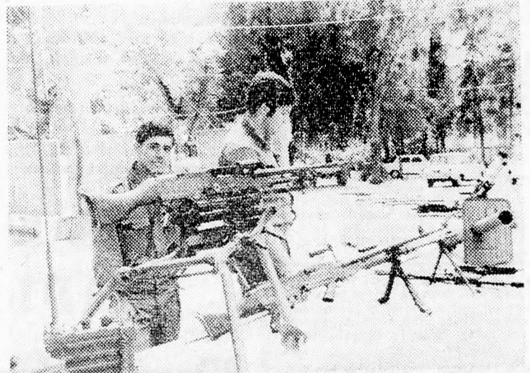
Az ejtőernyősök bemutatják fegyverüket a rámát-gáni Hámelech Dávid parkban, a város alapításának 50-ik évfordulója és a függetlenségi ünnep alkalmából.

Nyilván Rogers látogatása külsőben tett újabb maximalista nyilatkozatot Machmud Riad egyiptomi külügyminiszter, aki kijelentette, hogy Kairó hajlandó hozzájárulni, hogy az izraeli visszavonulás két fázisban történjen. A részleges visszavonulás nem lehet végcél és Egyiptom nemzetközi biztosítókat követel, hogy a visszavonulás teljes legyen. Riad azt követelte, hogy Izrael dr. Jarringhoz intézett hivatalos jegyzékben vállaljon kötelezettséget a teljes visszavonulásra. Miután elmozdították az izraeli csapatokat a Csatornától, az egyiptomi haderőnek át kell kelnie és a Csatorna megnyitását egybe kell kötni a teljes visszavonulással. Anuár Szádát egyiptomi elnök május elsején a Nilus deltájának egyik városában beszél a közelkeleti helyzetről.