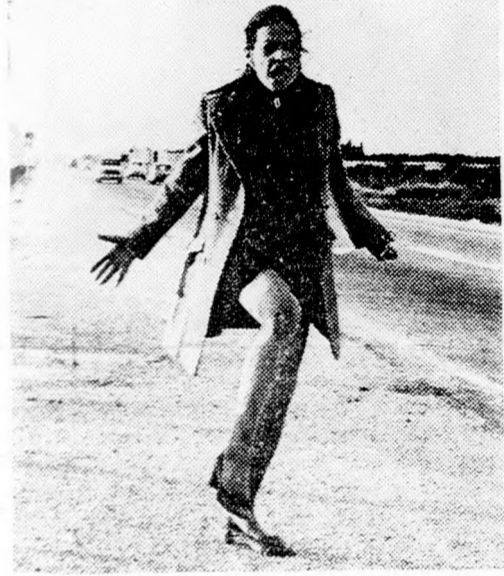
A férfi a film egyik szereplője.

„Néhány nappal ezelőtt bársony tápkapok sötétjébe, neszelenül érkezett meg az újabb hír: a fesztivál előzetes zsűrije, amely a Cannes-i minimum ügyében hivatalos döntést hozott, nem fogadta el a filmet. A zsűri levelét nem hozták nyilvánosságra, de nyilvánvaló, hogy Cannesben csak egyetlen ok miatt utasítanak el egy hivatalosan bemevezett filmet: ha az nem üti meg a ki-