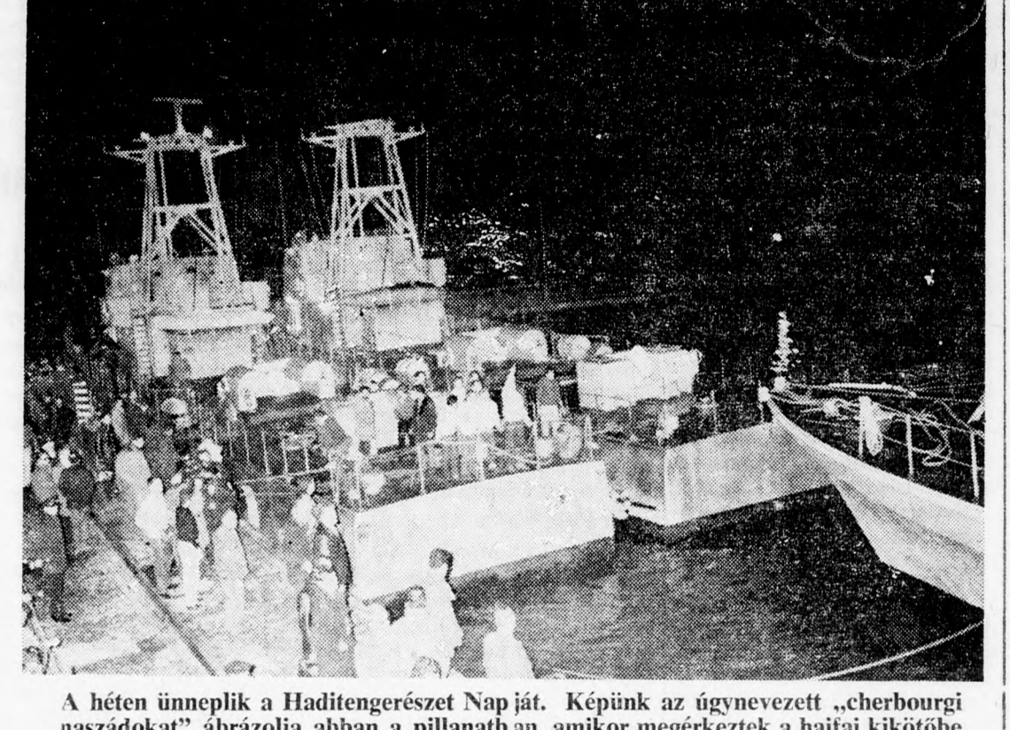
A héten ünneplik a Haditengerészet Napját. Képzelt az úgynevezett „cherbourgi naszádot” ábrázolja abban a pillanatban, amikor megérkeztek a haitai kikötőbe

NATANJA június 14, hétfő este 8.30-kor, „Wizo”-terem MOLNÁR FERENC: Játék a kastélyban című 3 felvonásos vígjátéka. Jegyek a Wizonál.