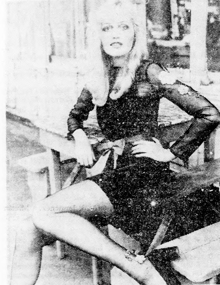
Két nagyon sikeres komplé Dior 1972-es kollekciójából