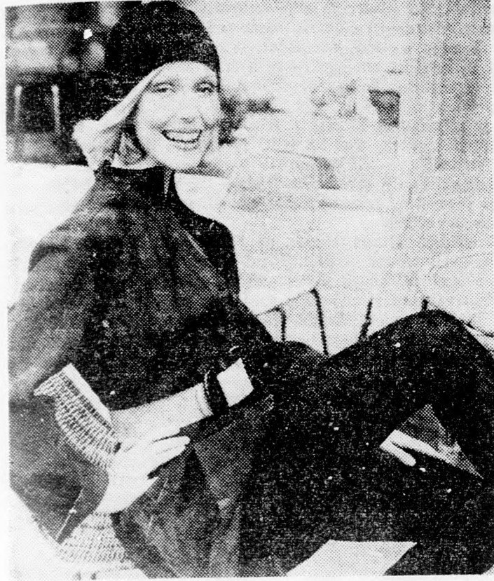
Két nagyon sikeres komplé Dior 1972-es kollekciójából