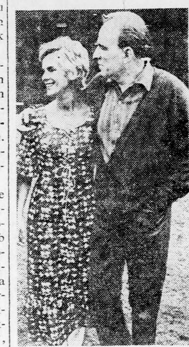
Ingmar Bergman és Bibi Andersson nyilatkoznak az amerikai televízióban „Az érintés” bemutatója alkalmából

zassága szeretetteljes és boldog és a szerelmes kiválasztása jóformán öngyilkos szándékúnak minősíthető belső elkészeredése utal.