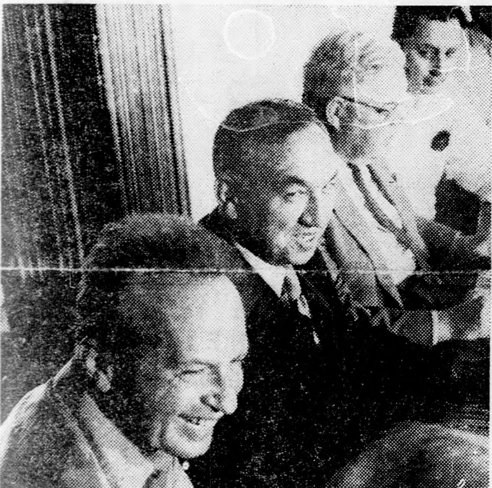
Rabin, Sisco, Barbour és Gávit helyettes külügyi államtitkár a luddi repülőterén

Joseph Siscoval izraeli tényezők a hivatalos tárgyalásokat csak heteken kezdik meg. Jeruzsálemi feltételek szerint az országba tegnap érkezett helyettes amerikai külügyminiszter, aki mintegy tíz napig lesz itt, nem hozott magá-