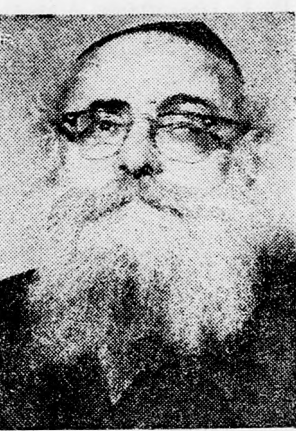
Jicchák Meir Levin rabbi

Jeruzsálem. (Az Uj Kelet tudósítójától). — A Sááré Cedek kórházban szombaton hajnalban elhunyt Jicchák Meir Levin rabbi, az Agudát Jiszraél világmegszervezője, akit csütörtök reggel szívórohammal szállítottak kórházba. Jicchák Meir Levin rabbi 77 évesen húzódott meg. Beszédeit erőteljesen vallásos álláspontja ellenére a tartózkodó bírálat és az emelkedett hangvétel jellemezte. Főként erkölcsi követelményeket támasztott a társadalommal szemben és Izrael vívmányait és katonai győzelmeit messzeemelően elismerve, azokban mindig Isten segítségének megnyilvánulását látta.