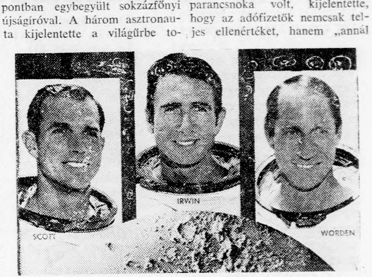
AZ APOLLO-15 HÁROM ASZTRONAUTAJA BALROL-JOBBRA: SCOTT, IRWIN, WORDEN

Mielőtt az asztronauták leszálltak volna az űrhajójukkal, az Apollo-15 három utasa a világűrben sajtófogadást tartott a texasi Houston űrutasú köz-