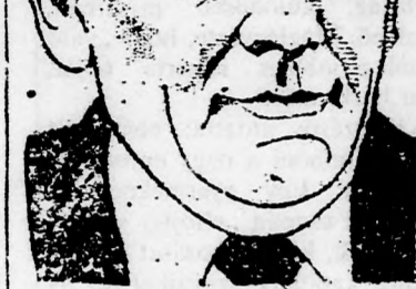
ÁLMOZI NINCS MÁSI KIÜT.

Jeruzsálem (Az Uj Kelet tudósítójától). — A ma reggel összeülő minisztertanács megvitatta az állami szolgálatban lévő orvosok ellen kiadott rögzítő parancsok feloldásának kérdését. Tegnep este valószínű volt, hogy a parancsokat feloldják.