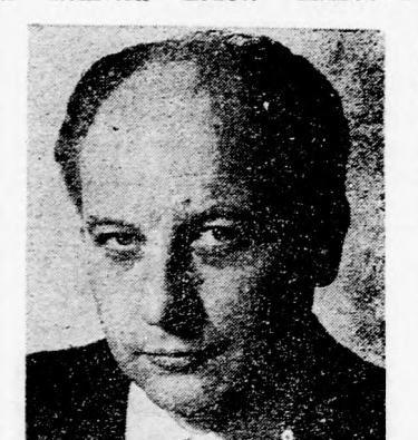
SCHEEL A jegyzék tartalma titkos

Szeptember 11-ikén hivatalos tárgyalások lesznek az arabok és a németek között Kairóban.