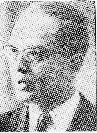
U-TANT Mi történik a táborokban?

Egy kérdésre válaszolva illetékes jeruzsálemi körök tegnap reggel megerősítették, hogy U-Tant ahol a menekültek az UNO égisze alatt működő segélyező ügynökség (UNWRA) támogatását élvezik, elkerülhetetlen volt megfélemlítő intézkedéseket fogantatni a biztonság fenntartására. A menekülttáborok lakói ugyanis az utóbbi időben a terroristák állandó fenyegetései alatt állottak, ami türelmetlenül tette az életet. Ezért határozta el a biztonsági hatóságok, hogy különböző „biztonsági utakat” vágnak a zsufoit menekült-táborokban. Az utak létesítésénél kényserültek a hatóságok arab családokat áttelepíteni El-Arisba, ahol kész lakásokkal várják őket.