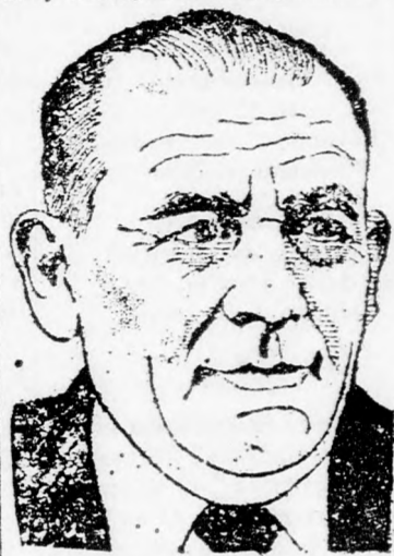
ÁLMOGI „Nem alkalmazunk erőszakot”

hogy betérjessék azt a törvényjavaslatot, amely a munkaezemenyek megszűntét sújtja és amely bizonyos munkakörökben az