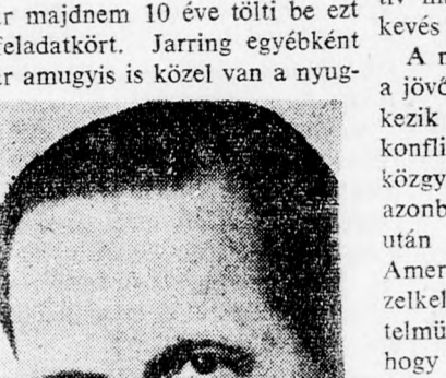
Jarring nagykövet azonban nem volt hajlandó közreműködni.

Másrészt, éppen a szovjet személyiség túlságosan pozitív véleménye ártott meg Jarring-nak.