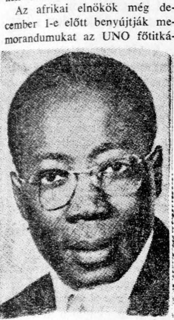
SENGHOR: Fontosabb a biztonság...

Az afrikai államelnökök az Izraelnek eljuttatott közvetítési dokumentumokban javasolják, hogy nemzetközi erőt állítsanak fel Sárm el-Sejken, az Izrael és Egyiptom közötti megállapodás értelmében. Ugyancsak javasolják, hogy az izraeli csapatok visszavonulása után, semleges zónákat állapítsanak meg, valamint nemzetközi garanciákat adjanak a határok biztosítására. A békehatárokat azonban — fejti ki az okirat — a két fél közötti tárgyalások alapján kell létrehozni.