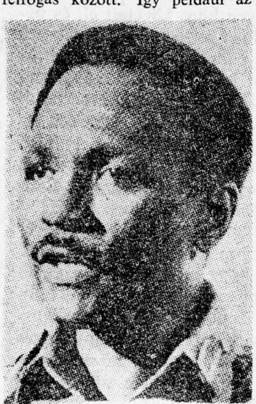
GOWON: ...mint a területek

megközelíti az izraeli álláspontot, a többi pontokban azonban nézeteltérések mutatkoznak a két felfogás között. Így például az