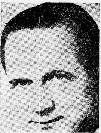
Dr. GUNNAR JARRING Az UNO új főtitkára?

ket a békeszerződésben szabnak meg. Izráel nem vonul vissza az 1967 júniusai elotti vonalakra”.