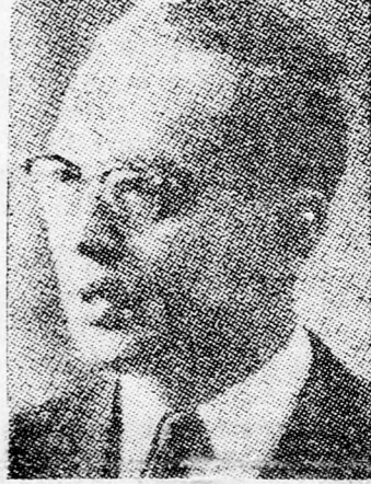
U TANT: Izráel irtse ki Szináj-t

U Tant jelentésében arra utal, hogy Jarring, aki utólagja szeptemberben és októberben járt New Yorkban, nem tudta folytatni kátyuba jutott tevékenységét és később nem tett újabb kezdeményezést, hogy szabad teret engedjen az amerikai kísérleteknek, amelyek amidegig nem vezetnek pozitív eredményhez. Ugyancsak beárta az afrikai elnökök békekötési kísérleteit. U Tant még mindig azt reméli, hogy „Izráel a közeljövőben olyan választ ad, amely lehetővé teszi Jarring további működését”. A főtitkár szerint a legutóbbi fejlemények ismét bizonyítják az évi jelentésében hangsúlyozottakat, amely szerint mindkét félnek biztosítani kell Jarring minimális feltételeinek tel-