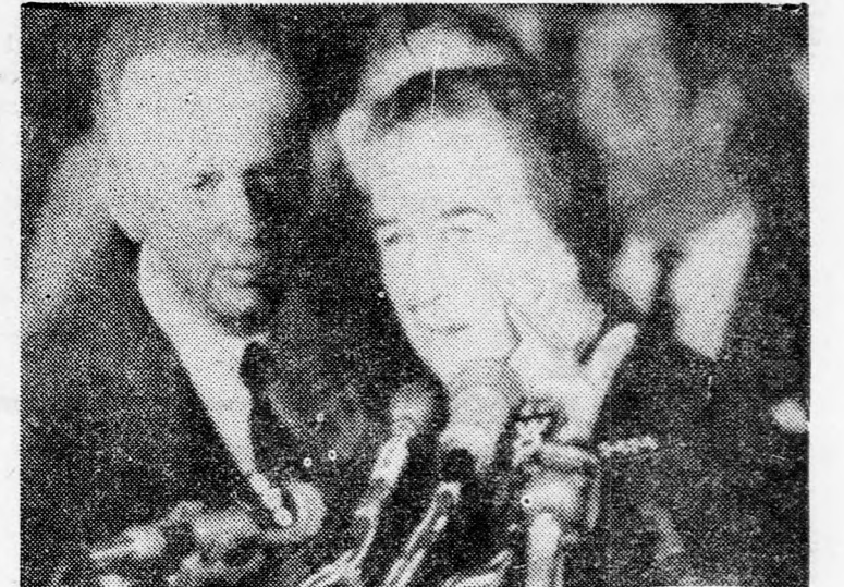
Golda Méir és Jichak Rabin a washingtoni repülőtéren

Nixon elnök Golda Méir fogadása előtt ma délután az amerikai Nemzeti Biztonsági Tanács ülésén elnököl, amelyen valószínűleg a közelkeleti helyzetről is tárgyalni fog.