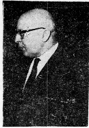
SZÁPIR 5-10 éves terveket készítünk

Közölte még a miniszter, hogy 1972-ben az ország kivitele elérte a két milliárd dollárt, tehát fejle-