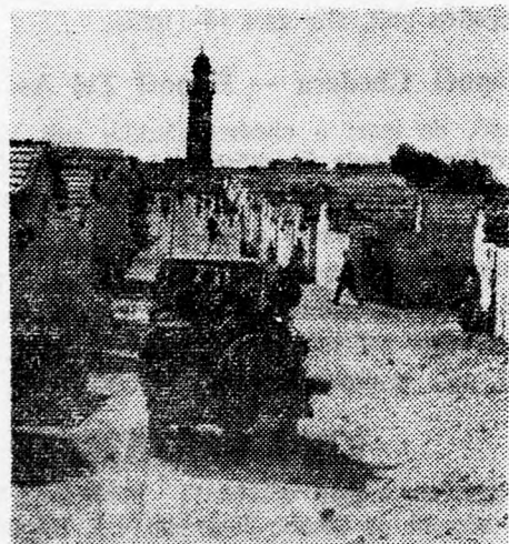
Egy házsört romboltak le bulldozerekkel, hogy lehetővé tegyék az utat a menekülttábor központjában

Az izraeli hadsereg jelenlegi biztonságérzetét kitűnően illusztrálja az a kép, amely a