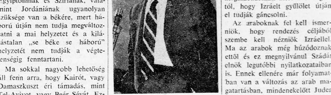
Izrael biztonsági problémája az arab-izraeli kapcsolatok egészét érinti.

kisebbsége a békére, mint Jeruzsálemnek.