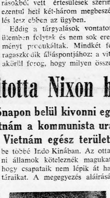
Henry Kissinger, az elnök tanácsadója tegnap elmondta, hogy Amerika már fél év előtt közölte hajlandóságát, csapatainak kivonására 1972 augusztus 1-ig, amennyiben a megállapodást legkésőbb 1971 szeptember elsején aláírják és életbe lép a fegyverszünet. Ezt Észak-Vietnám elutasította. Hanoi azt követelte első feltételként, hogy Amerika távoítsa el Dél-Vietnám kormányát.

val általános fegyverszünet lépne életbe, amely nemzetközi ellenőrzés alatt állna. Nixon végül nemzetközi garanciákat ajánlott fel az indo-kínai államok szuverenitásának és a tartós békének biztosítására.