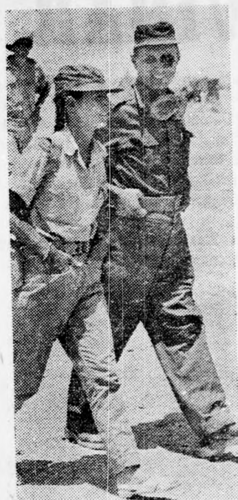
APA ES LÁNYA

A hatnapos háború egyik sikerült felvétele: Mose Dáján tábornok, hadügyminiszter lányával Jáállal — aki haditudósítóként működött — az egyik frontszakaszon.