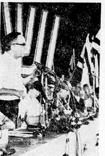
PINKUSZ Nem diktálhatunk

A Hadassza delegátusai élesen ellenzik a mult csütörtökön elfogadott többségi határozatot, amelyet egyrészt irreálisnak, másrészt méltánytalannak tartanak