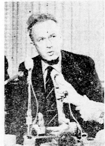
JICCHAK RÁBIN: Pontos körülhatárolás

Amerika Golda Meír döntését várja az Izrael-amerikai egyezmény megkezdését követően. A tárgyalások pontjára nézve. Hétfőn mintegy félórás megbeszélés volt Sisco és Rábin között, majd ezt követően Sisco ismét összehívta a minisztertanácsot. Rábin és Sisco találkozásánál a jelek szerint mindkét részről engedmények történtek az amerikai követelések korlátozásait illetően. Amerikai megfogalmazás szerint Izrael elvételét követelt magának a számára elfogadhatatlan amerikai javaslatok iránt, amelyeket Joseph Sisco a közvetítő tárgyalások során vetne fel.