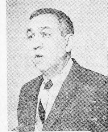
JOSEPH SISCO: Aggodalmak eloszlátása

Washingtoni vélemény szerint Amerika mindent megtejt, hogy megállapodás jött létre, amelyben „Amerika kötelezte magát, hogy Izrael rendelkezésére bocsátja a szükséges technikai felkészültséget a Phantom harcigépek előállítására.”