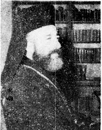
MAKÁRIOSZ: Érsek, vagy elnök?

Ezzel egyidőben a ciprusi görögkeleti egyház püspökeit felszólították Makárioszt, hogy mondjon le az elnökségről, mert az nem egyeztethető össze egyházi méltóságával. Válaszként erre Makáriosz hívei tömegtüntetéseket rendeztek, azt követelve, hogy az 58 éves érsek továbbra is maradjon Ciprus elnöke. Nicosiában 40 ezer főnyi tömeg tüntetett Makáriosz mellett. Ez volt a legnagyobb tüntetés 1959 óta, amikor a sziget görög lakosságának legnagyobb része kivonult, hogy üdvözölje a számfüzetésből hazatérő érseket.