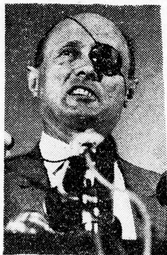
Aktiv — de nem jelölt...

A biztonsági helyzetről szólva, Dáján a következőket mondta: „Izrael továbbra is tudja tartani a Szezi-csatorna vonalát. Részleges elrendezés esetén kategórikusan ki kell jelenteni, hogy a háború befejeződött. Nincs értelme olyan részleges elrendezésnek, ha fennáll a veszélye a tíz kiújulásnak rövid idővel az egyezmény aláírása után. Ha biztosak volnának abban, hogy az arabok igazi békét akarnak, megengedhetnének.”