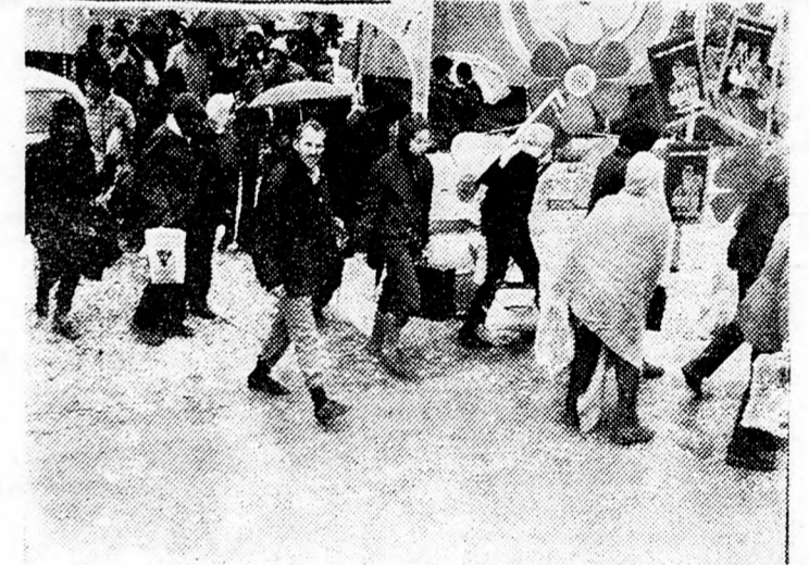
Börig ázva indulnak haza az eső miatt félbeszakadt tárgyalások résztvevői. (Beszámoló a 3. oldalon)

Tegnap Chámúdi Kánáán volt söchemi polgármester minden megindokolás nélkül bejelentet- te, hogy visszavonja jelölését.