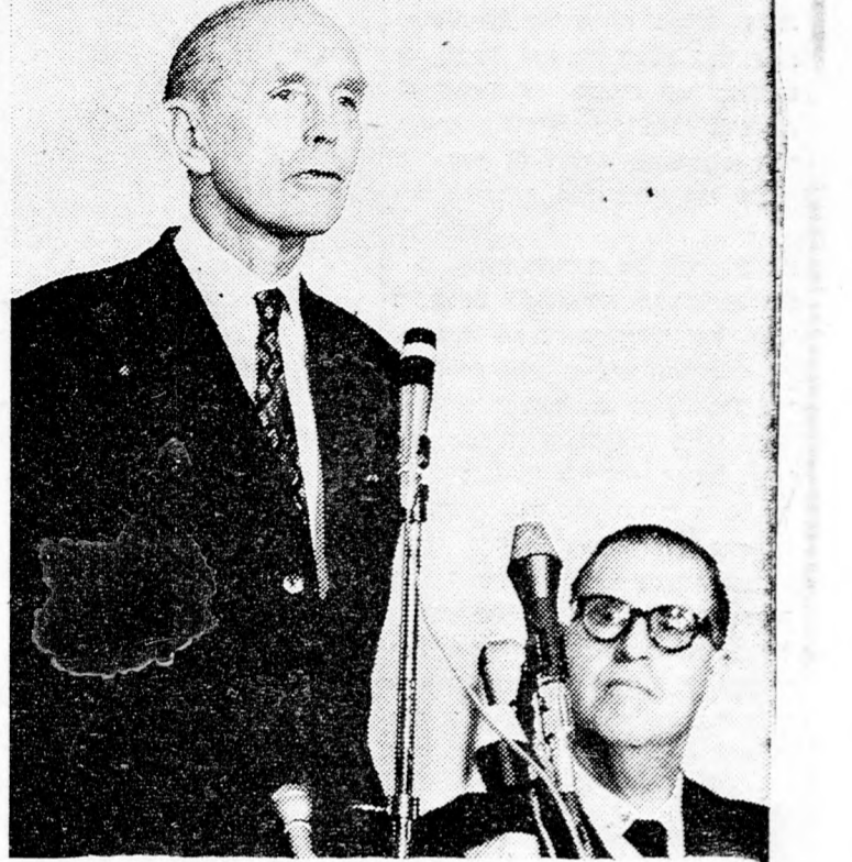
A luddi repülőtéren: Aha Even figyelmesen hallgatja Sir Alec Douglas-Home nyilatkozatát

nek, Sir Alec így válaszolt: — Douglas-Home, aki a rámat- Douglas-Home, aki a rámat- gani angol nagykövetségen szál-