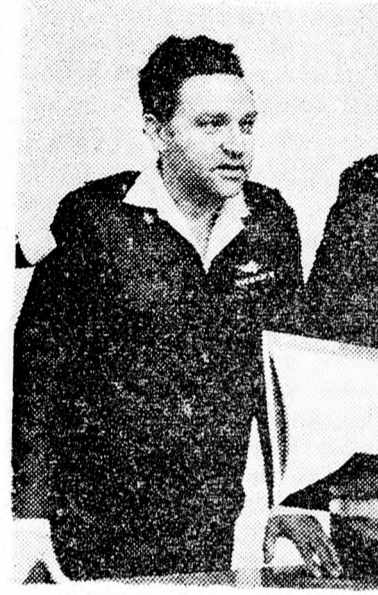
Láhat tábornok (Bér Lév mellett) átadja az Albumot

Pénteken ünnepélyes keretek között átnyújtották Chájim Bér-Lév ipar és kereskedelemügyi miniszternek, volt vezérkari főnöknek az „Ezer Nap Albumát”, mely a „kifulladásos háború” ezer nap-