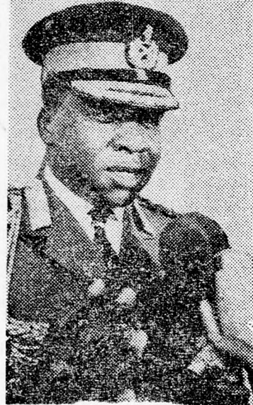
IDI AMIN: „Az izraeliek torkonragadják”

katonai repülőterek létesítésével foglalkozott Ugandában. Ezek Egiptom elleni repülőhadakozás bázisaként szolgálhattak volna. Háború esetén jörfőrmán elkerülhetetlen lett volna, hogy Uganda is belekeveredjen az újabb közelkeleti konfliktusba, és ez volt az