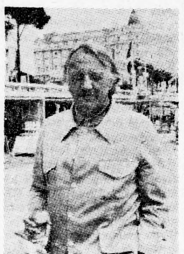
majd később szerény anyagi keretű filmek rendezésével bízták meg.

sem bizonyítottak rá, a hollywoody stúdiók bélistára tették. Losey Angliába tette át székhelyét, ahol televíziós filmeket rendezett más művész-név alatt.