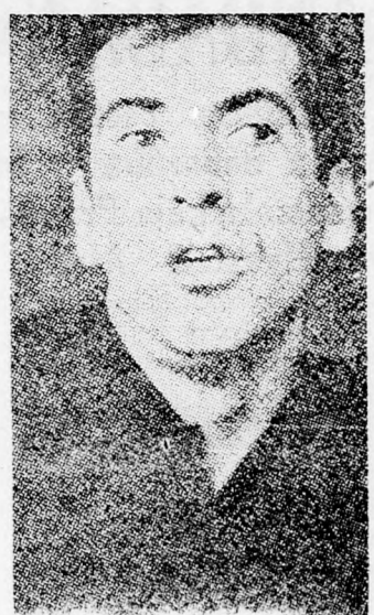
badítani a skatulyából, amelybe besorozták: a hervadásnak induló, de még frivol szexbomba skatulyájából, aki másodrendű vigjátékokra fecsérelt tehetség.

— Én akarok lenni az első, aki igazán komoly szerepet kínál Brigitte Bardot-nak. Komoly, nagy színésznőt akarok csinálni belőle, ki akarom szá-