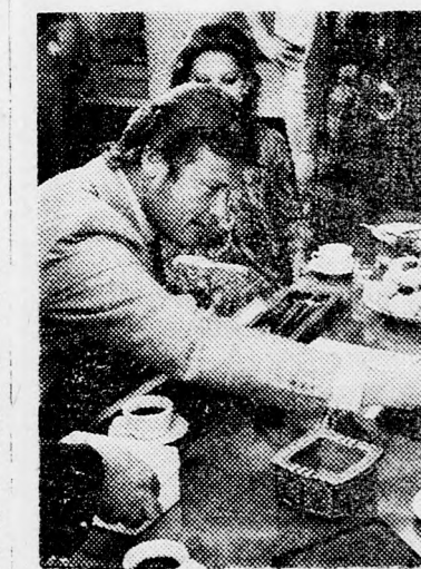
Az „Angyal” Mose Daján hadügyminiszterével

gól-zsidó művész barátaitól. — és az épülő Izrael. Találkozni az állam vezetőivel, a hadsereg