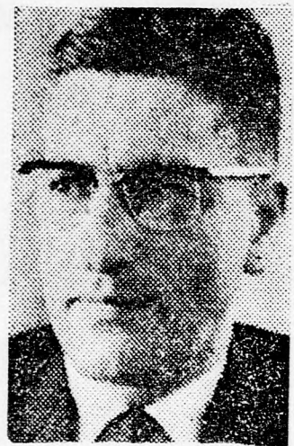
DR. NEBENZAHL Ötven panasz

Az államellenőr véleménye szerint az egyetlen segítség az, ha megfelelő felhatalmazással felruházott közéleti személyiséget — minisztert vagy alminisztert — neveznek ki az állami adminisztráció problémáinak tanulmányozására és a szükséges konkrét javaslatok megtételére. Elmondotta még, hogy a Kneszet legközelebbi ülészakánának első napjaiban benyújtja első jelentését az állami