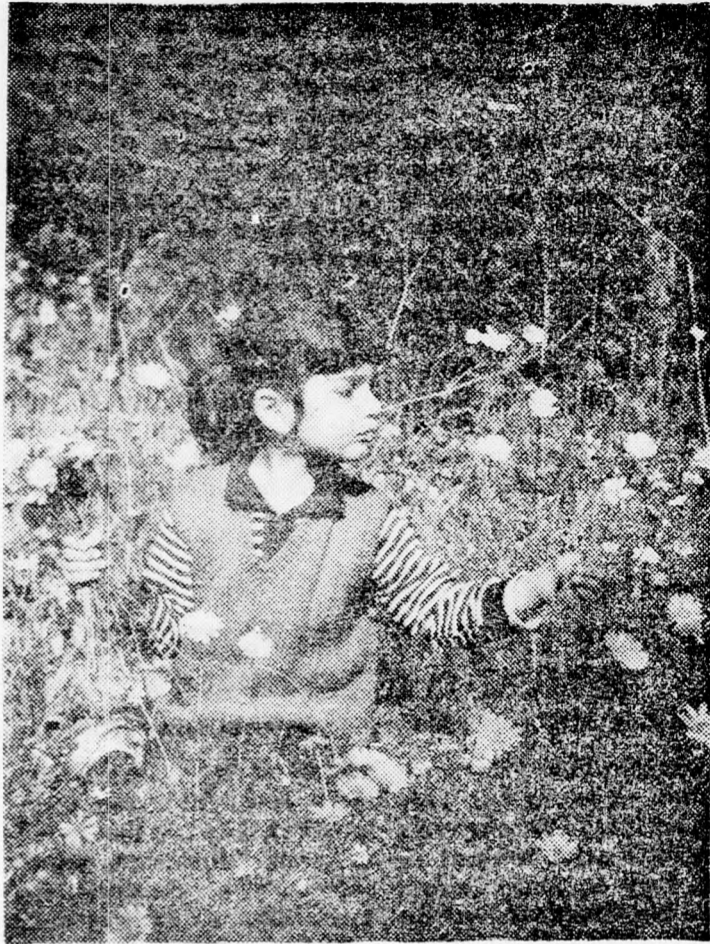
Virágot szedő kislány a zöld mezőben Lág Báomer napján.

Bár Kochbá kénytelen volt el hagyni a gyengén megerősített fővárost és az ellenség foglalta el. Bár Kochbá a megerősített Betár városába vonult vissza. A rómaiak ostromot indítottak a város ellen, de az ostromlótak halálát megvetően harcoltak. (Folytatás a 7-ik oldalon)