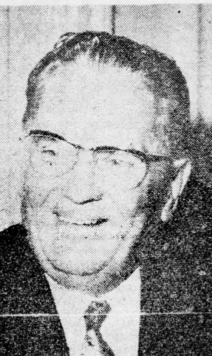
TITO Uj szetek?

San Diego (Reuter, IFP, UPI). — Hatalmas robbanás történt tegnap a szivattyutelepen, amely mérgező hatású üzemanyagot szivattyúzott ki az Apollo-16 űrhajóból. A robbanás következtében 46 embert kórházba szállítottak. Az Űrkutatási Hatóság szóvi-