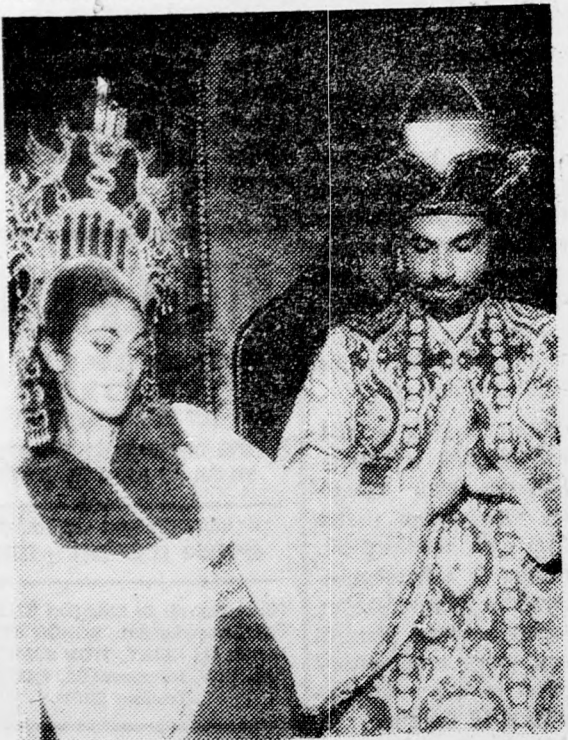
AZ „INBAL” JERUZSALEMBEN

Tel Aviv város kulturális osztálya megígérte a „Pince-színház”-nak, hogy megfelelő termet szereznek a számukra, erre azonban még nem került sor. Most folyik „Az ígért szép szó