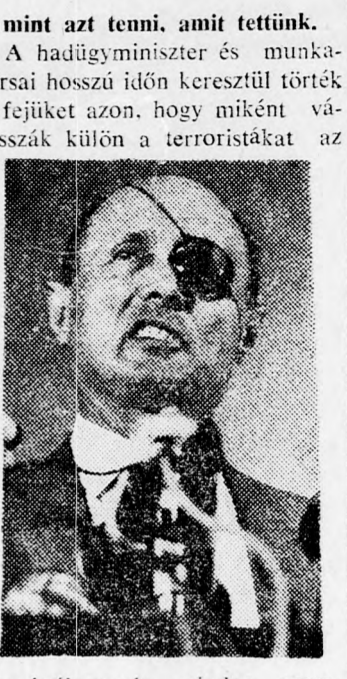
Mint azt tenni, amit tettünk. A hadügyminiszter és munkatársai hosszú időn keresztül törekedtek arra, hogy miként válasszák külön a terroristákat az utasoktól, amely minden szempontból előnyös lett volna.

Bécs, (Reuter). — Románia és Kelet-Németország 20 évre szóló barátsági és kölcsönös segítségnyújtó szerződést kötött. A szerződés aláírása végetvet a két ország között uralkodó feszültségnek, amely 1966 óta állt fenn, amikor Románia teljes diplomáciai kapcsolatot létesített Nyugat-Németor-