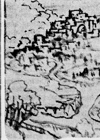
WITTMAN D.: AKKÓI VÁR

körülmények között ének, csak keveset mentettek ki onnan és adtak nekik jobb lakáslehetőséget. Az igazság kedvéért meg kell állapítani, hogy már megteremtették a hajlandóságot arra, hogy lehetővé tegyék az arab lakosság átköltözését új lakásokba, de csak nagy összeg ellenében. Másrészt, a lakók nem sietnek átadni az épületeket, még akkor is, ha dűle-