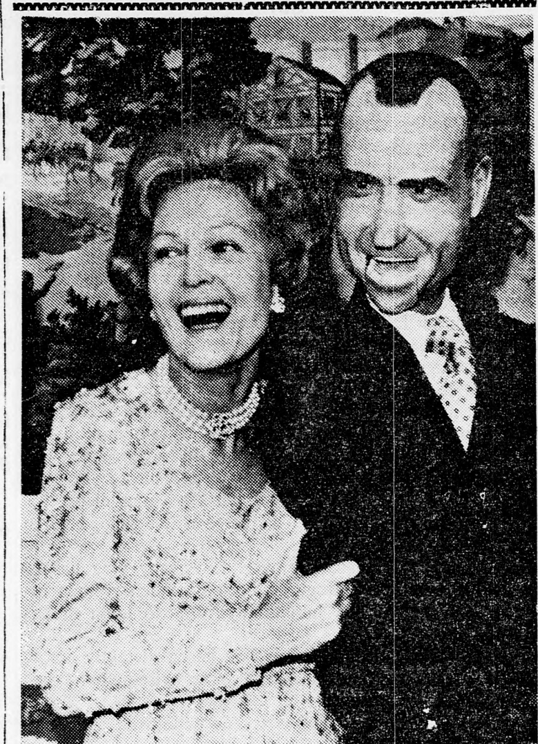
Nixon elnök felesége érti a tréfát. A Fehér Házban, egy újságírók számára adott ebéden hajlandó volt lefelfigyelni magát a mellette álló bábuval, aki férjére hasonlít, s aki „beszédet is mondott”, természetesen hangszalagról.

Egy néhány hónappal ezelőtt készített összeírásból kiderül, hogy Egyiptomban 800 zsidó él és dolgozik. Kairóban és Alexandriában templomok vannak, ahol imádkozhatnak. A hatóságok megengedik a zsidó ügyvédeknek, fogorvosoknak és üzletembereknek, hogy zavartalanul dolgozhassanak.