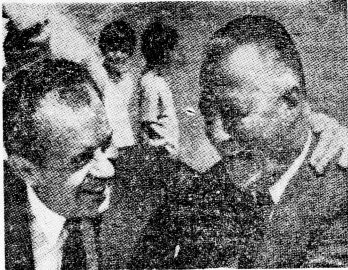
NIXON ES AGNEW Komoly és konstruktív tárgyalások...

A fegyverkezés ellenőrzéséről szólva, azt mondotta Nixon elnök, hogy a moszkvai egyezmény igen nagy fontosságú, mert így most nem kell további 15 milliárd dollár jóváhagyását kérni a Kongresszustól az atomfegyver fejlesztése céljaira. A Szovjetunión tervbe vette mintegy 1000