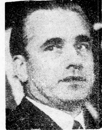
JACQUES CHABAN DELMAS: Siker a nőknél

delmiadó törvény egyik szakaszát kihatásnával, éveken át nem fizetett jövedelmi adót.