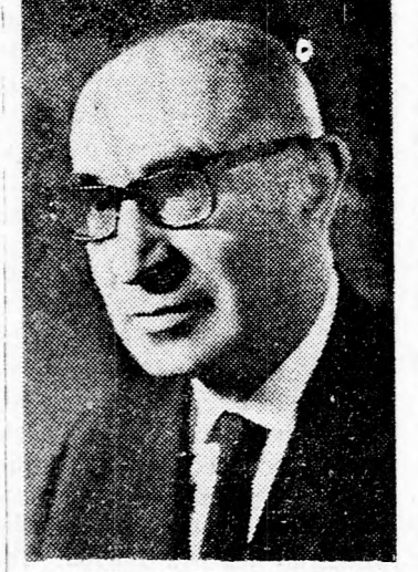
RABINOVICS polgármester: 12 ezer szállodai szoba

Javasolta a polgármester kongresszusi központ létesítését is Tel Avivban, ami azonban csak állam-