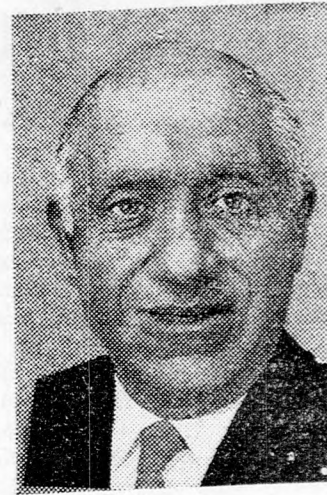
JAVITS: Tüntető látogatás Izraelbe

Arra a kérdésre, hogy mi a véleménye Jicchák Rábin nagykövet tevékenységéről, aki egyesek szerint beavatkozott Amerika belügyébe, a szenátor ezt mondta: „Az a véleményem, hogy