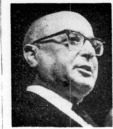
Pinchas Százir pénzügyminiszter.

helyzetéről szólva Százir kiemelte, hogy nem minden pesszimista jövődőlés vált be, de még mindig nem lehet pontosan tudni, vajon túljutottunk-e az inflációs válságon. „Vannak bizonyos té-