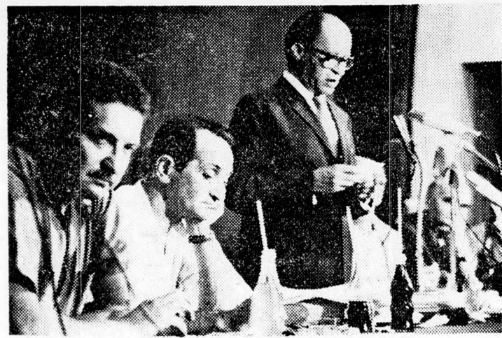
MENACHEM BEGIN: „A Gáchál jövője?”

A nyilatkozat további részében leszögezi, hogy a tervezett választási reform, ha megvalósul, abszolút többséget biztosít a Kneszetben a Munkapártnak, annak ellenére, hogy ez a párt nem élvezi a nép többségének bizalmát. Ez a mesterséges többség — szögezi le a Chérut nyilatkozata — elhatározza majd, hogy újra feloszlassák Izrael földjét, ezenkívül pedig lehetővé teszi a szocialista Mááráchnak, hogy teljesen dominálja az országot, anélkül, hogy irott alkotmány korlátozná ezt az