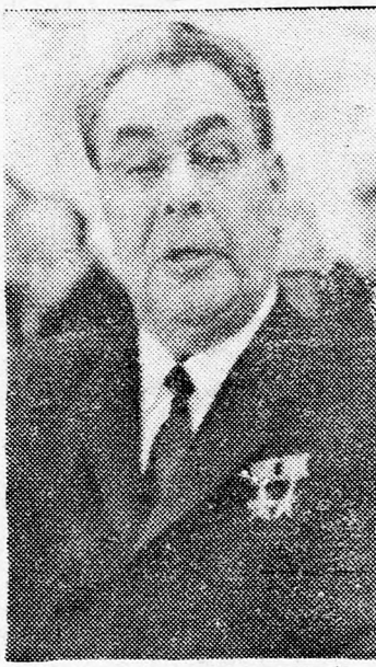
LEONID BREZSNYEV Fegyver — nyet!

Jeruzsálem (Az Uj Kelet tudósítójától). — Dr. Kurt Waldheim és dr. Jarring állítólag új kezdeményezéseit Jeruzsálemben szakszissal fogadták. Ha azonban igaz — mondják —, hogy az UNO főtitkára és dr. Jarring a távirati irodák jelentése szerint és egy beírult lapban megjelent részletezésen alapuló új tervet dolgoztak ki, úgy Izrael természetesen komoly mérlegelés tárgyává teszi az új indítványokat. Az azonban kétségtelen — mondják Jeruzsálemben —, hogy a Jarring küldetés akármilyen formában való felújításának alapfeltétele, vonja vissza, vagy változtatja meg a svéd diplomata azt az egyoldalú álláspontot, amelyet múlt év decemberi memorandumában juttatott kifejezésre. Jeruzsálemi feltevés szerint a Waldheim és Jarring féle állítólagos kezdeményezések nincsenek esélyei. Jeruzsálem tudomása szerint,