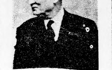
JARRING Újabb próbálkozás?

A nyugati partvidéket ismét egyesítik Jordániával és a gázai sávot is csatolják ehhez, biztosítva számára egy korridor, amelyet az UNO csapatai ellenőriznének. Jeruzsálem problémájának megoldására alapként szolgálhat Huszsein király terve.