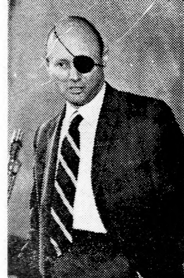
Az oroszok távozása nyomán...

Az érdekes tartalmú levélre még nem érkezett válasz. ● Tel-Avivban tegnap a kommunista párt és a Mápam fiataljaiból álló csoport szimpátia tüntetést rendezett a Dizengoff téren Birám és Ikrít falvak lakóinak támogatására.