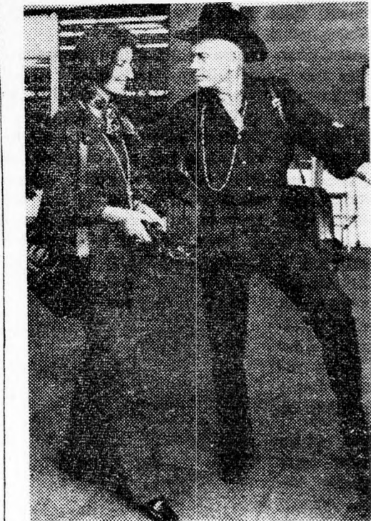
★ YUL BRYNNER FELESEGE, JACQUELINE DE CROISSET TÁRSASÁGÁBAN ★

tíz éve teljesen kopasz, de kopaszágát eddig különböző sűrűségű és minőségű parókkal kamuflálta. Először a „Love Story”-ban határozta el, hogy leveti álcáját,