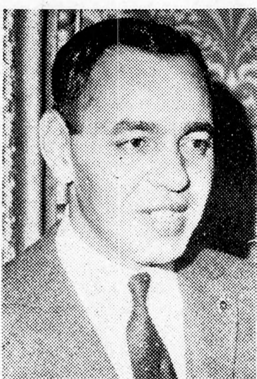
II. HASSZÁN — másodsor is megmenekült

A repülőgépek később közpületeket támadtak a fővárosban.