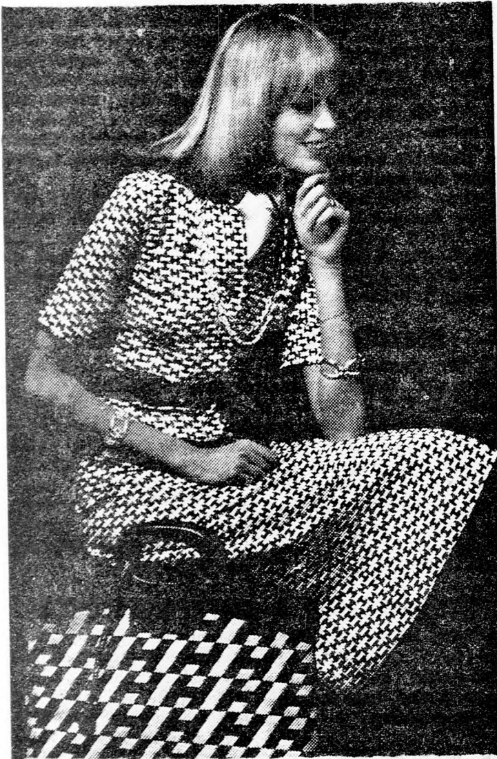
Barna és fehér aprómintás diolen loft ruha, a kivágásban fehér nyerselyem sállal.