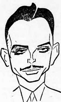
HUSSZEIN Nem volt találkozó