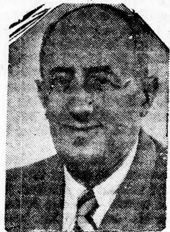
Mose Kol, a turisztikai miniszter.

sen váltja meg a jegyét és egyedül intézve ügyeit akár Izraelbe jönni, az utolsó pillanatban megdondja magát, mert fél, hogy nem kap szobát. Már olyan hírek járnak külföldön, hogy a jövő évben, elsősor-