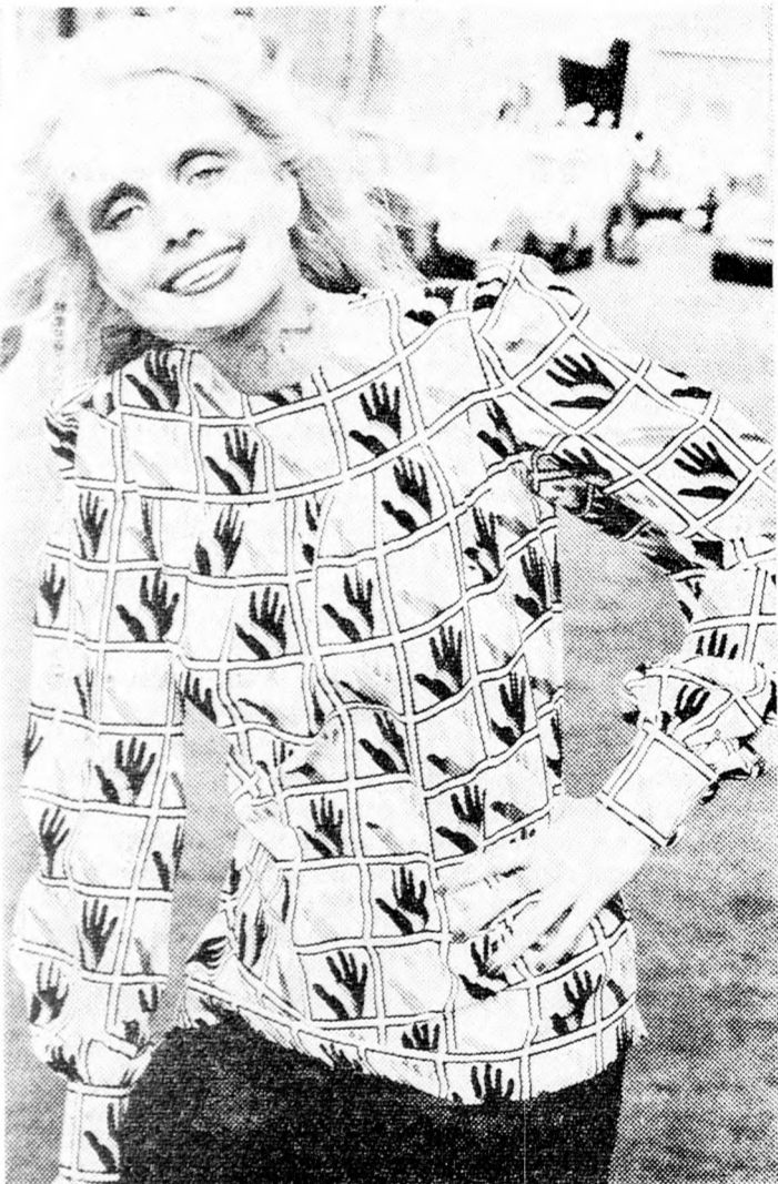
Jean Patou kreációja: tiszta selyem fehér blúz ráimprimált fekete, zöld és sárga kezekkel.