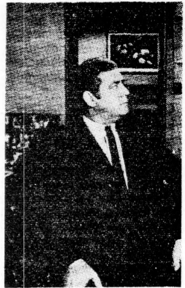
és a hozzávaló bűncselekmények logikus kibogozását.

nélkül szinte már el sem tudjuk képzelni a tévé szombat esti műsorát. A mindentudó rokkant detektívfelügyelő ismert, közvetlen barátunkká vált az idők folyamán és kíváncsian várjuk hetenként megismétlődő, de mégis változatos kalandjait