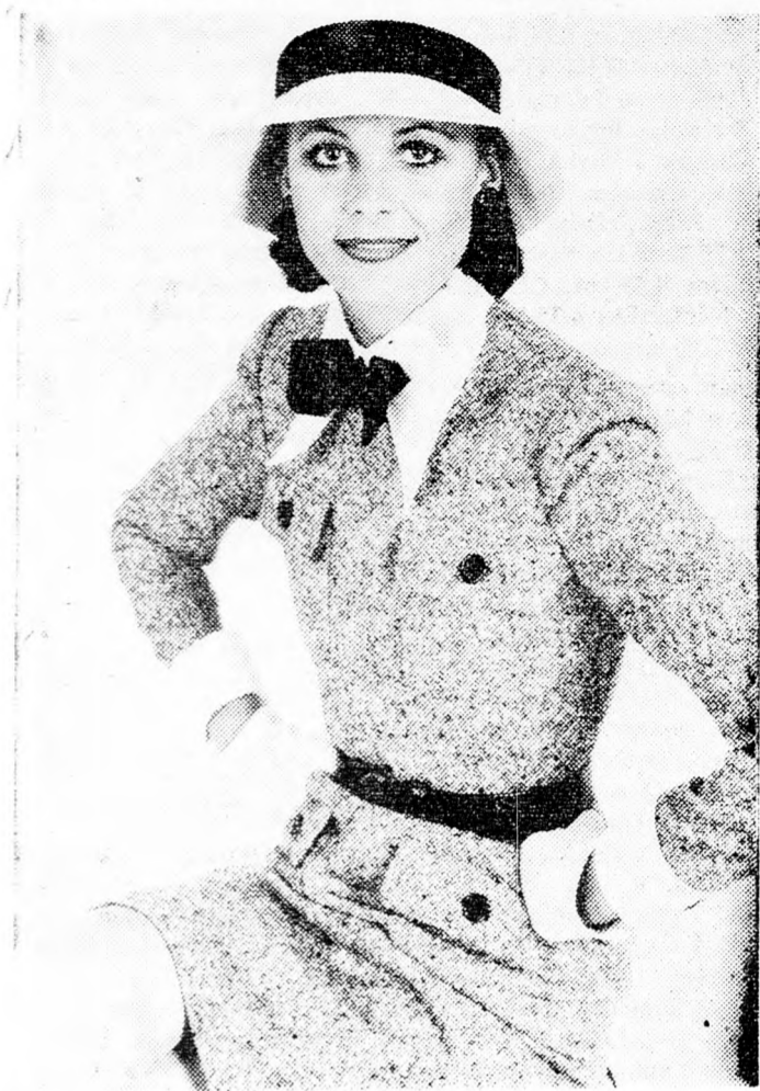
A sötét szín lesz a domináló az idei divatban. Nina Ricci tervezte ezt a sötét sportruhát négy rávarrt zsebbel, gombokkal, övvel, fehér gallérral és manzsettákkal. A kalap is fehér, az övvel és nyakkendővel azonos színű szalaggal.