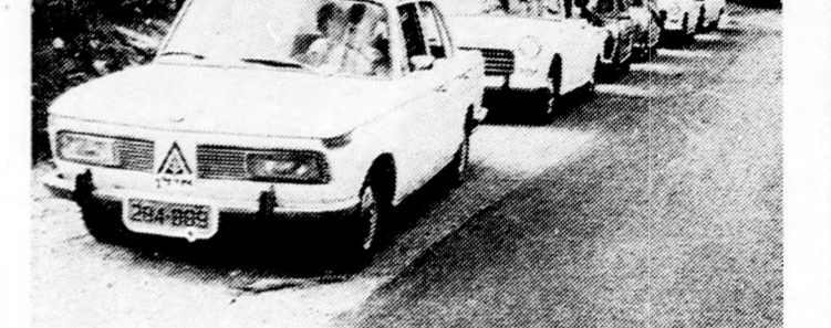
Az Ilán 54 rokkant tagja vett részt a rokkantakat istápoló szervezet első autótúrán. A túrát a Páz és Delek cégek védnöksége alatt bonyolították le.

Mark Spitz a jelenlegi olimpia legesélyesebb eredményeit elérő sportolója, tegnap megszerezte hatodik aranyérmét, amikor a