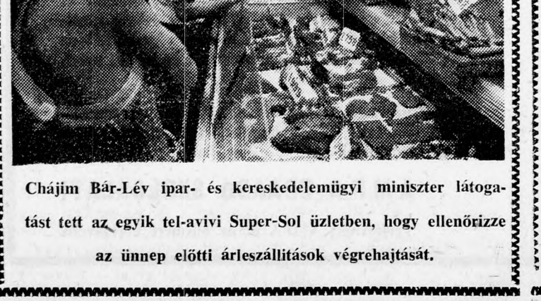
Chajim Bár-Lév ipar- és kereskedelemügyi miniszter látogatást tett az egyik tel-avivi Super-Sol üzletben, hogy ellenőrizze az ünnep előtti árszállítások végrehajtását.

Hogy a konferencia milyen hatással lesz a Münchenben egy besereglett atlétákra, az vitatható. De a konferencia résztvevői kétségtelenül sokat tanultak egymástól. „Megtanultam ezen a konferencián, hogy mit nem érhet el a sport, jelentette ki az egyik résztvevő. „A szervezett sport túl jutott a romantikus profitorál aknázzák ki. Amit úgy látszik valamennyien elfelejtettünk az az, hogy a sport állítólag jóték. (Newsweek)