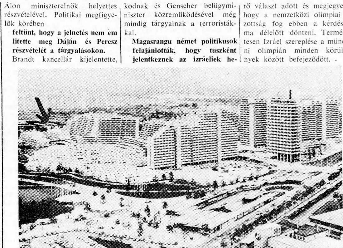
AZ OLIMPIA-FALU, AHOLO A TERRORTÁMADÁS TÖRTÉNT NYÍLLAL JELELTÜNK A GAZTETT SZÍNHELYÉT

A király nyilatkozata szerint a bűntény az egész kultúr világ ellen irányul.