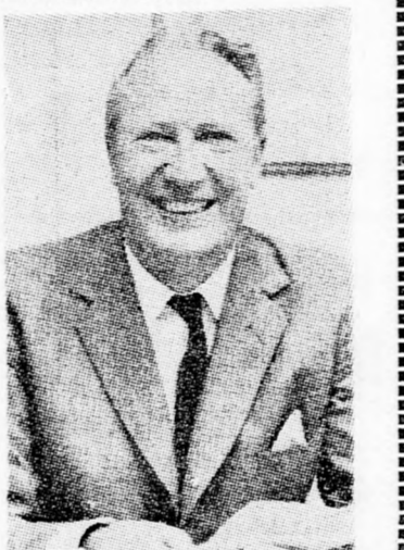
„Elképzeltetlenség, hogy megcsókoljon egy nőt”

A nőkkelt kapcsolatos nemi nehézségekről a szerző a többi közt magát Edward Heath édesanyját idézi, aki állítólag kijelentette: „Elképzeltetlenség, hogy Teddy megcsókoljon egy nőt...”