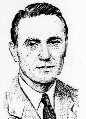
RIBICOFF Törvény a „törvény” ellen.

De nem minden esetben segít a kölcsön sem. Feldmann el-