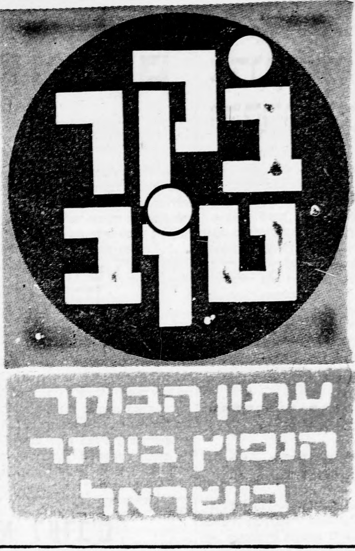
20.9.72 • יום רביעי, י"ב תשרי תשל"ג • מס' 264

אזעקת שוא בדבר הטמנת פצצה שיתקה ביום ב' בערב למשך שלושת רבעי שעה את פעילותו של נמל ה"תעופה האנובה" לנמל התעופה. לאחר שלושת רבעי שעה של חיפושים מדוקדקים בחפצי נמל התעופה, לאחר שלושת רבעי שעה של חיפושים קשדניים, כאשר לא נתגלה כל פצצה שחיא חזרה התעופה כולו יפוצץ בסביבות 16:00 שעה 9 בערב לפי השעון המקומי. ה"הרגיל