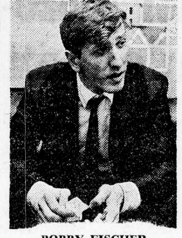
BOBBY FISCHER Drága világbajnok...

Semmi kétség sem fér ahhoz, hogy az olimpiász győztese ezúttal is a szovjet válogatot lesz, amelyben három volt világbajnok foglalja el az első három táblát: Petroszian, Tál és Szmiszlov. Ezzel szemben nem játszik Szpazszi, aki nemrégiben veszítette el a