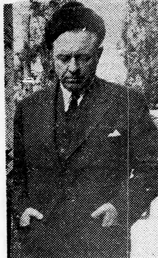
TEDDY KOLLEK A tisztviselő szívrohamot kapott

létesítésként külön hivatalt az ügyekben, miután a Közoktatásiügyi Minisztérium nem hajlandó erre. Tíznyolc millió fontos terhet hagytak jóvá erre a folyó évre, további 17 milliót pedig a jövő évre. Amikor azonban a város illetékes tisztviselője megjelent a közoktatásiügyi minisztériumban a pénz felvételére, közölték vele, hogy mindössze három millió fontos terhet hagytak jóvá az előzőleg megbeszélte 18 millió fontból. A tisztviselő a megrázkódtatást szívrohamot kapott és a Bikur Cholim kórházba szállították.