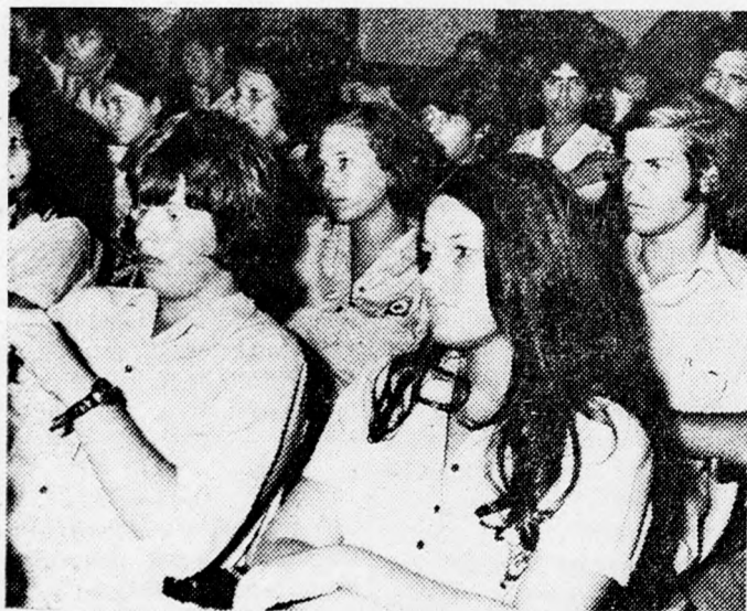
Az „Ifjuság az ifjuságért” szervezet tagjai a Bét Lessinben megtartott, klitaproblémákkal foglalkozó gyűlésen

A Bné Brit keretében működő „Ifjuság az ifjuságért” szervezettel-néki avívi körzetének tagjai tegnap közgyűlést tartottak, melyen a