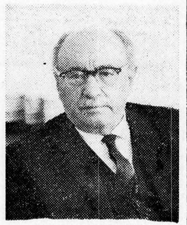
AZ ÁLLAMELNÖK Izrael a zsidó nép szíve

„Miképpen Jeruzsálem Izrael állam fővárosa, úgy vált Izrael állama a zsidó nemzet szívévé. Az eltelt negyed évszázad alatt Izrael állama nem szűnt meg a nemzet különböző részeinek