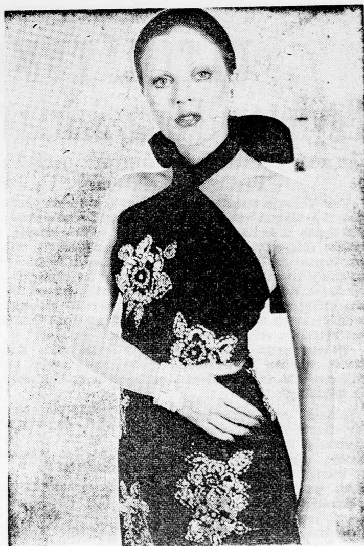
Christian Dior mutatta be ezt az estélyi ruhát ezüsttel átszőtt fekete selyemből.

A szerkesztő néhány nappal ezelőtt visszatért New Yorkba és a fentebb vázolt problémákról már a Jewish Spectator legközelebbi számaiban értekezni fog.