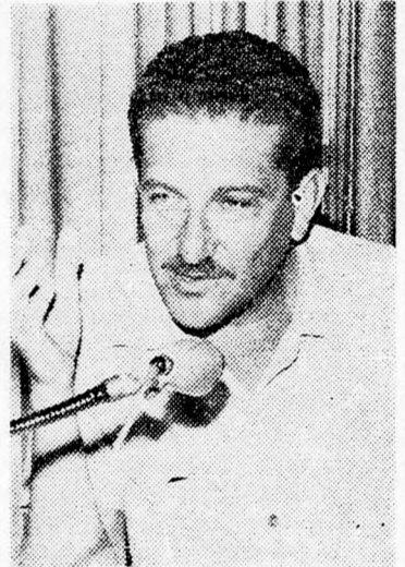
EZER WEIZMAN: „Oda útni, ahol a legjobban fáj”

Weizman azt hangoztatta, hogy miután Izrael biztonsági szempontból megbukott Münchenben, a kormányának le kellett volna mondania. Ugyisint le kell vonni a következtetéseket a biztonsági szolgálat vezetőivel kapcsolatban, akik kudarcot vallottak és el kell bocsátani őket. Hangsúlyozta, hogy az Egyiptom, Sziria, Libanon és Líbia, valamint a terror elleni küzdelem egyetlen harcának kell tekinteni, amelyek nem választhatók külön. Ezek az államok a terror eszközeihez folyamodtak, mint hogy a harcmezőn vereséget szenvedtek. Különbséget kell tenni nemzeti felszabadító mozgalmak és olyan terror-csoportok között, melyeket szuverén államok irányítanak. Így tehát figyelmeztetni kell ezeket az államokat, hogy Izrael a legérzékenyebb pontokon fog lesújtani rájuk, ha nem szüntetik meg a terrorista tevékenységét.