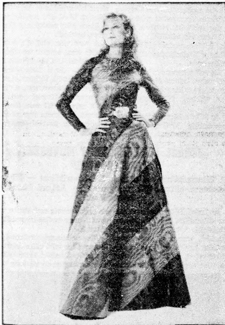
Kétszínű estélyiruha, ferde, rózsaszín és élénkzöld széles csíkokkal.