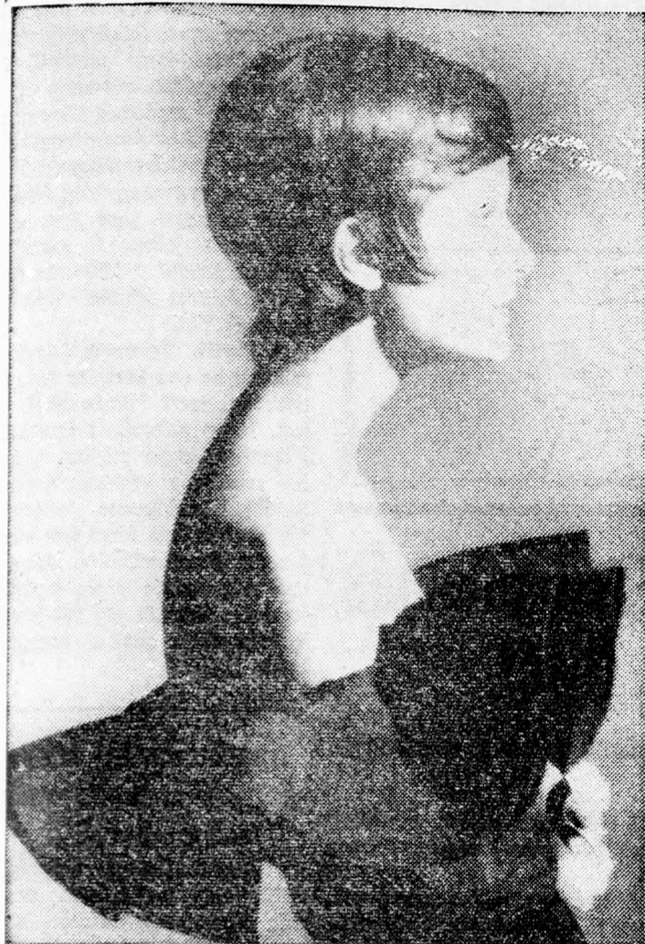
Modern vonalú frizura. Ezen a téren a hajviselet „kis fej” formálására törekszük.