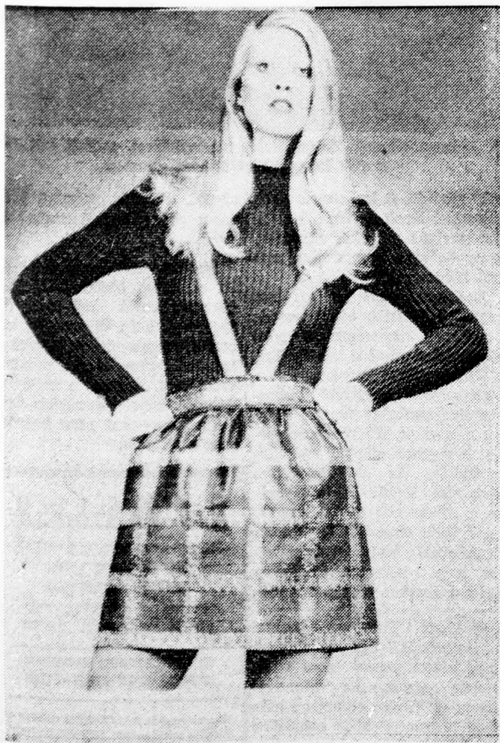
Sportruha, amelyet Paco Rabanne mutatott be: bőrkantáros kockás szoknya, tiroli kövecskékkel díszítve.