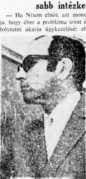
JUVÁL NEEMAN A fizikusok világkonferenciáján beszélt

Arje Pinkusz, a Cionista Világszervezet vezetőjének elnöke a váltságdíj elleni küzdelem folytatására hívta fel a hallgatóságát.