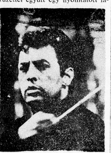
ZUBIN MEHTA Húsz napja...

Joe Stasher visszavonta 300 ezer fontos követelését Menáchem Porus rabbi Kneszet-képviselő ellen.