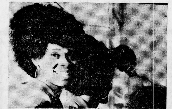
Fenti képként egy délamerikai fotomodelt ábrázol, akivel a jellegzetes afrikai frizurát propagálják.