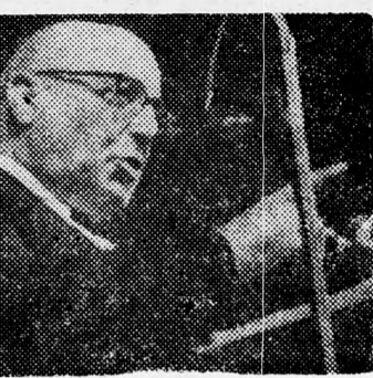
SZÁPIR En csak sámesz vagyok...

Hangsúlyozta azt is, hogy nem ellenzi az Aser bizottság javaslatát az értéktöbblet-adó bevezetésére nézve, de technikai szempontból nincs lehetőség tárgyalásokra kerül sor közöttünk és az arab államok között. Hangsúlyozta, hogy ez alatt nem érti Jeruzsálem és a Golán-fennsík visszaadását, tisztelt és becsüli a Teljes Erec Jiszráelért Küzdő Mozgalom emberreit, de igen távol áll tőlük.