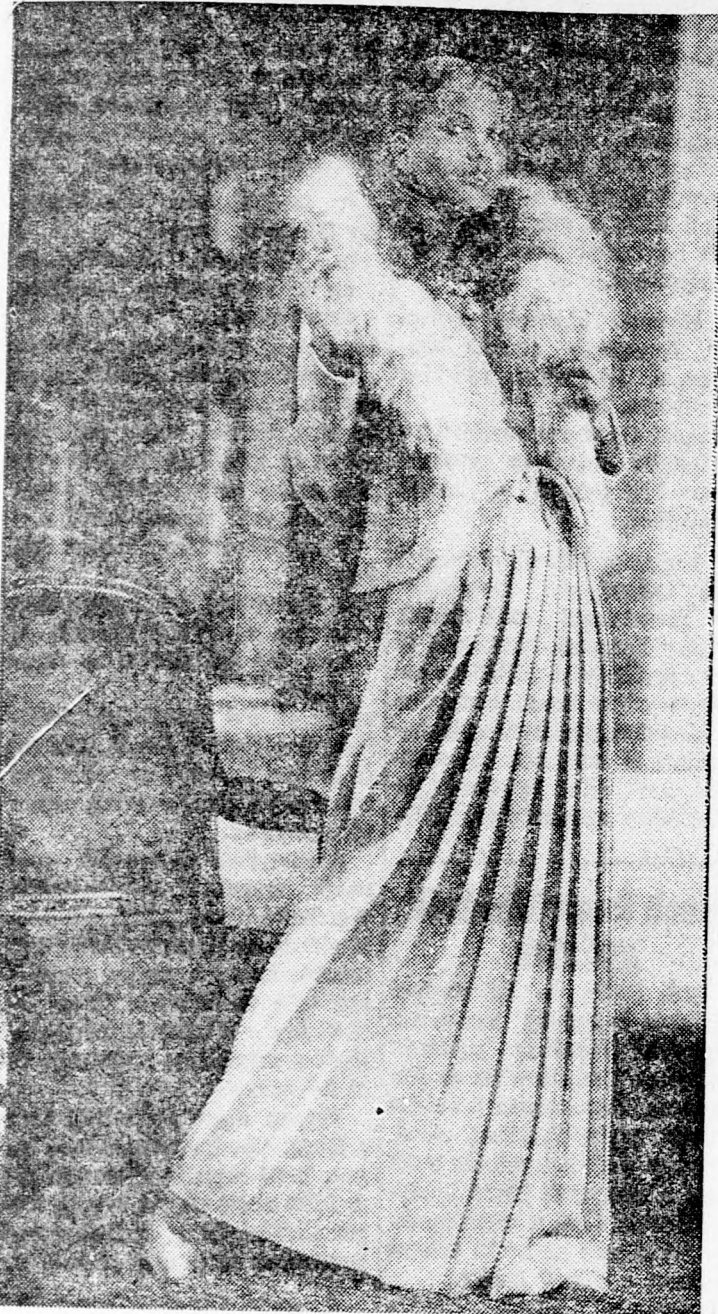
A Dior-ház mutatja be ezt a beige-színű selyemruhát. A ruha ki-vágása mély V-alakú és szoknya-része pliszírozott.