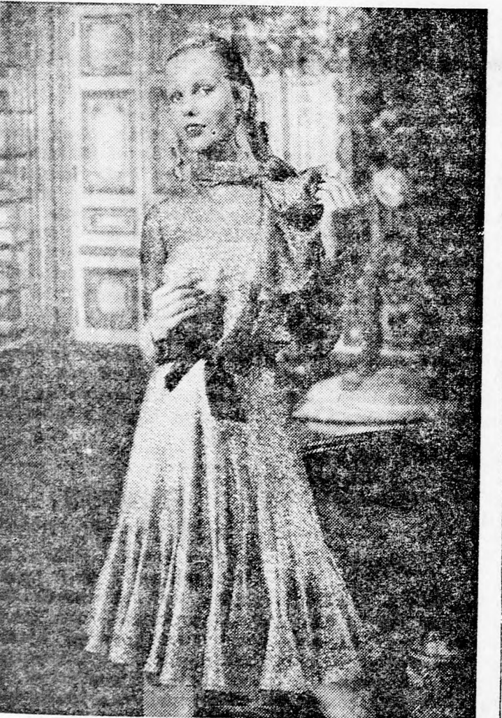
Ezüstlámé koktél-ruha, lila bársony övvel. A ruha felső része túllógó készült, a szoknya fodrokkal végződik.