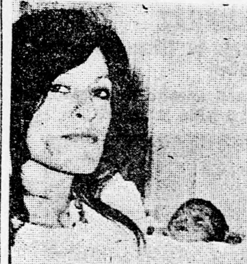
A fiatal mama az egyik kishabával

A jeruzsálemi Sääré Cedek kórház szülészeti osztályán régen volt ilyen nagy szenzáció. A vékonydögájú mama tréfásan jegyzi meg: