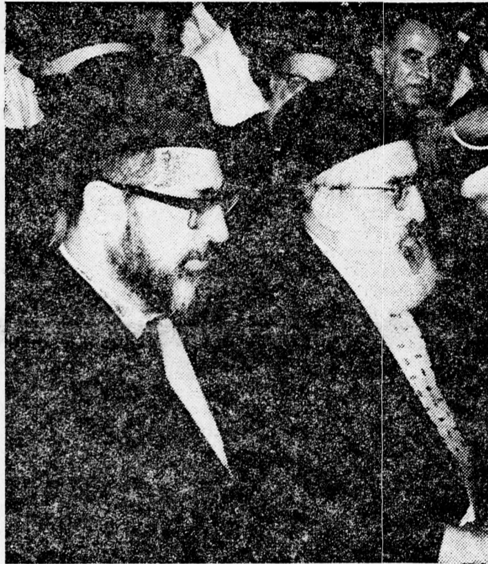
GOREN ÉS JOSZEF FŐRABBIAK

megemlítette, hogy szándékában áll különleges vallási bíróságot is létrehozni a „mamzerék” néven nyilvánartartott testvérpár ügyében.