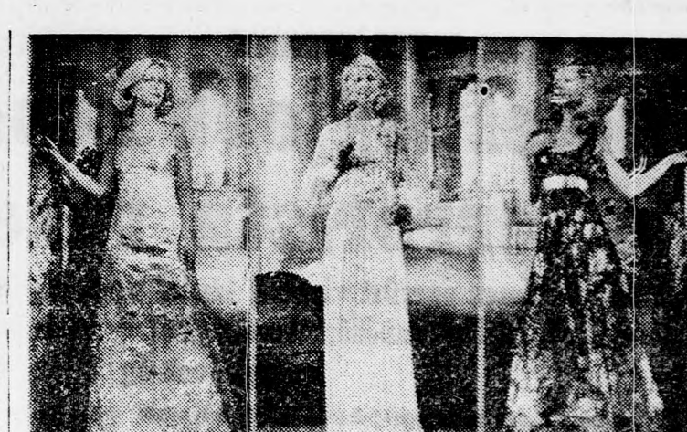
Három estélyi ruha, a párizsi Brent-divatház modelljei. A kö-zépső, fehér ruha felső részét gyöngyök és payette díszíti, a szoknyán hat nagy berakás van. A másik két estélyi ruha nehéz selyemből készült és nagy virágok díszítik.

Azok az idősebb anyák, akiknek sokévi várakozás után sikerült erős és egészséges gyereket a világra hozni, leírhatatlanul boldogok és jóformán nincsenek tekintettel azokra a nehézségekre, amelyeken a terhesség ideje alatt, a szüléskor és utána, keresztül mentek.