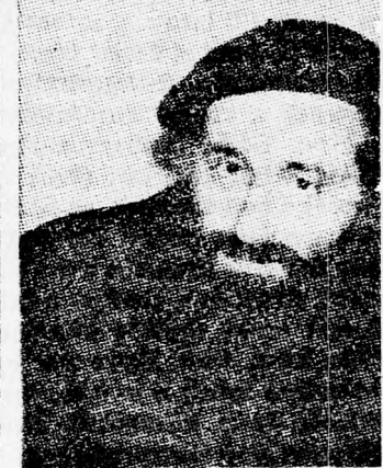
szabásu nemzetközi nyomást kell gyakorolni — méghozzá nyíltan — azoknak az érdekében, akiknek a kérvényét elutasították.

„Amellett vagyok, hogy fokozzuk a nyomást a szovjet hatóságokra és a lehető legjobb a leghangosabb kampány keretében. Csak a nevek feleslegesek, mert az igazság az, hogy az utóbbi hetek folyamán a szov-