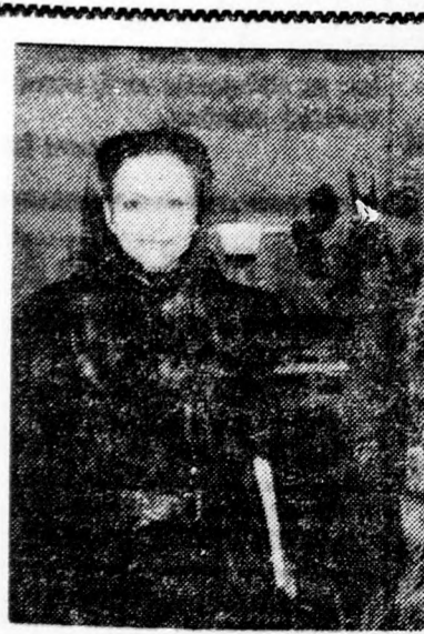
Francia művészek a szörmedivat szolgálatába állították magukat. Képünkön: Juliette Mills és Francoise Hardy láthatók, akik a propaganda élére álltak.

Természetesen azt is megvizsgálta a bizottság, hogy mit lehet e veszélyek ellen tenni. Javaslatait néhány pontban összefoglalva terjesztette a t. Ház elé.