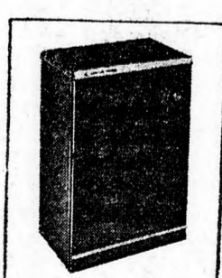
Modell 6000 659.- IL.