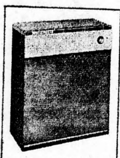
Modell 8000 790.- IL.