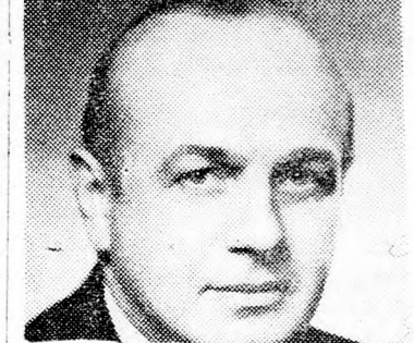
TEKOA Csak egyetértés útján

rozatokat tartja kötelezőnek magára nézve, amelyeket a vele lefolytatott előzetes tanácskozások után szavaztak meg. Fontos az, hogy a határozati javaslatok megszövegezésénél